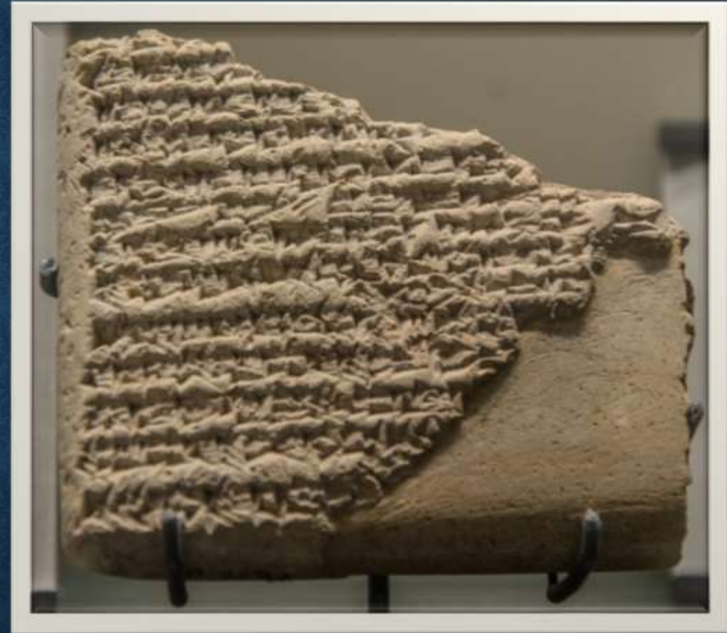
Die Geschichte der Geburt von Sargon, Anfang des 2. Jahrtausends v. u. Z.

„Scharrukin (= Sargon), der starke König, der König von Akkade bin ich. Meine Mutter war eine Verstoßene, meinen Vater kannte ich nicht. Die Verwandtschaft meines Vaters wohnt im Gebirge. Meine Geburtsstadt ist die Stadt Safran, die am Ufer des Euphrat liegt. Es empfing mich die Mutter, die Verstoßene gebar mich heimlich. Sie legte mich in einen Korb aus Schilf, mit Asphalt verschloss sie meine Öffnungen. Sie ließ mich auf dem Fluss nieder, aus dem ich nicht mehr selbst emporsteigen konnte. Der Fluss trug mich, zu Aqqi dem Wasserschöpfer brachte er mich. Aqqi der Wasserschöpfer holte mich wahrlich durch ein Eintauchen des Eimers herauf. Aqqi der Wasserschöpfer nahm mich zu seiner Sohnschaft an, er zog mich wahrlich groß. Aqqi der Wasserschöpfer setzte mich wahrlich in seine Gärtnerarbeit ein. Bei meiner Gärtnerarbeit gewann mich die Ischtar wahrlich lieb. (x?) Jahre übte ich wahrlich die Königsherrschaft aus. Die schwarzköpfigen Menschen beherrschte und regierte ich wahrlich.“